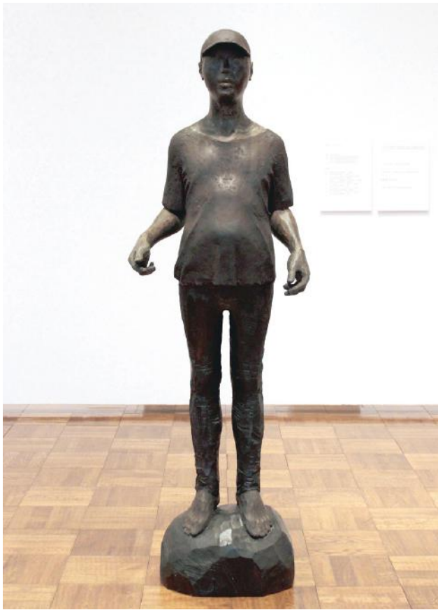
「石の上から見た景色」木・漆 H190×W45×D40 (cm) 2017年